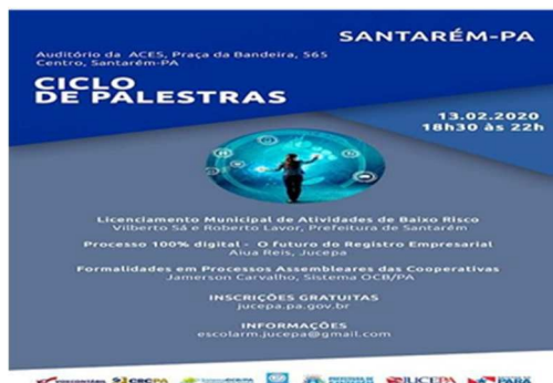
Figura 4 – Ciclo de Palestras Registro Mercantil

Em fevereiro, JUCEPA e Sistema SESCOOP/OCB-PA realizaram o Ciclo de Palestras do Registro Mercantil, evento presencial em Santarém aos Profissionais, estudantes de contábeis e áreas afins, bem como, cooperativas, servidores públicos, com participação de 206 pessoas.