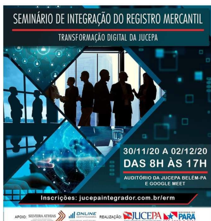
Figura 3 – Seminário de Integração do Registro Mercantil.

Em novembro de 2020, a JUCEPA promoveu o I Seminário de Integração do Registro Mercantil, sob o tema “Transformações digitais da JUCEPA” reuniu coordenadores regionais e técnicos da sede com o intuito de apresentar as novidades e inovações para o registro e legalização de empresas. Em razão das restrições sanitárias com a pandemia, o evento foi híbrido, com participações presenciais e por web conferência, ao todo, foram capacitados 61 servidores da sede e das Unidades desconcentradas.