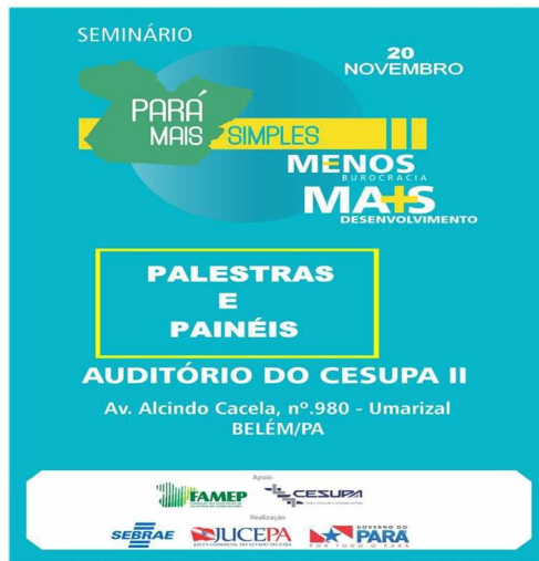
Figura 2 - Cartaz de divulgação Seminário Pará mais simples.

O Governo do Estado do Pará, por meio da Junta Comercial do Estado do Pará – JUCEPA, e o Sebrae realizaram o Seminário Pará Mais Simples, no auditório do Cesupa II, com participação de mais de 200 pessoas. O objetivo do seminário foi divulgar e capacitar servidores e gestores públicos municipais, estaduais, além de estudantes e profissionais interessados, nas questões atinentes à simplificação e à desburocratização do registro de empresas.